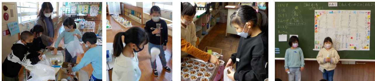
【秋ランドを運営する1年生と各コーナーで楽しむ2年生】

○2年生を招いて「秋ランド」を行いました。秋の宝物を使って体験する、4つのコーナーをつくりました。みんなとても素敵な笑顔でした。