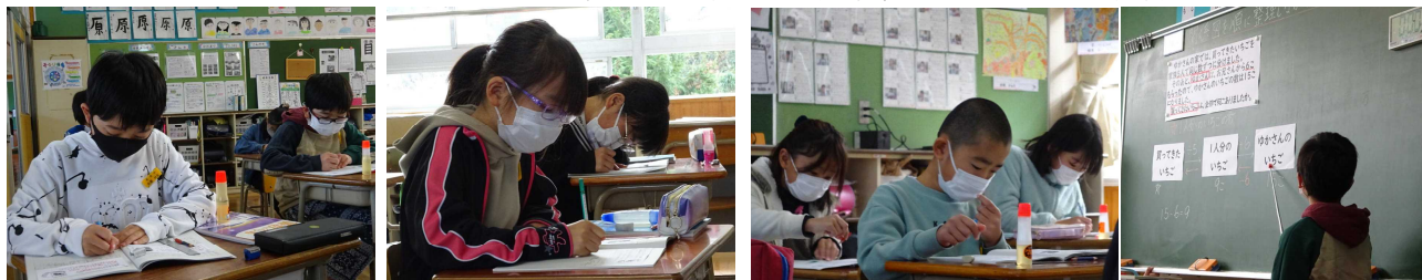
【問題に対し、集中して自力解決に取り組み、自分の考えを全体に伝える4年生】

○算数科の時間に、今まで何度も問題に合わせて作成してきた「関係図」を活用して問題を解いています。個人での追究→全体での交流→考えの再構築という流れで学習しています。