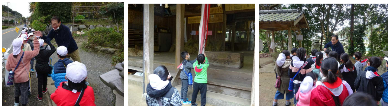
【地域の探検を通して、地域の方の思いを学び、新たな気づきを楽しむ2年生】

○校区探検を行っています。たくさんの場所の見学とお話を聞かせていただき、子どもたちは多くのことを体験的に学んでいます。今後行う学習のまとめが楽しみです。