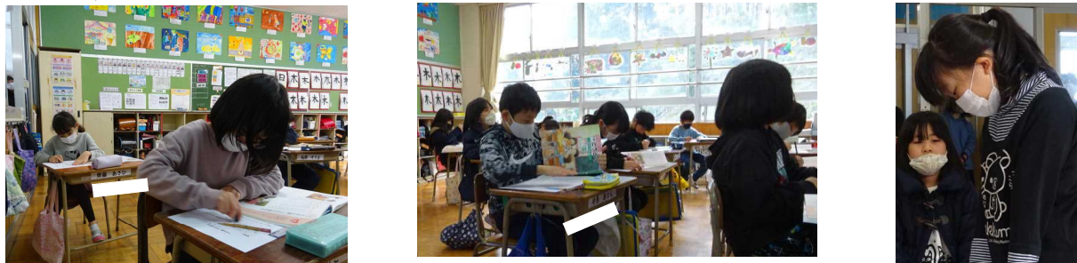
【教材を基にしながら、自分の考えをつくっています。その後、意見交流を行っています。】

○道徳科の時間に「うわさ話」についてみんなで話し合いました。「うわさ話」を聞いたときの気持ちや言われている人の立場を考えながら、どのようにすることが大切なのか考えました。