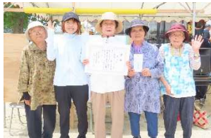
第3位 新町 A チーム

5月31日(日)、引津青少年育成校区民会議の主催で学童相撲大会が行われ、40名の児童が参加しました。今年は個人種目だけでなく、子どもたちを東西に分けた団体戦も行われ、白熱した取り組みが繰り広げられました。相撲をとる真剣な姿、勝って喜び負けて悔しがめる姿、友だちを応援し慰める姿、子どもたちのさまざまな姿を見ることができ、大変有意義な大会となりました。大会に関わっていただいた役員・ボランティア・保護者のみなさま、ご協力ありがとうございました!