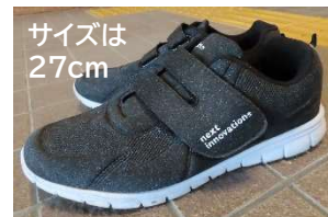
黒に近いグレーに白いソール

靴の履き間違えが発生しました。お心あたりの方は、引津コミュニティセンター(☎328-0855)までご連絡をお願いします。