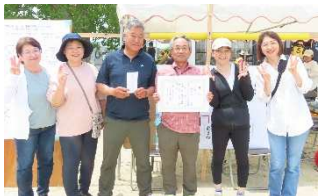
第3位 東貝塚チーム