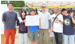
優勝 芥屋 C チーム

5月24日(日)、引津校区振興協議会の主催(主管:体育委員会)でモルック大会が行われ、24チーム、138名が参加しました。暑すぎない絶好のモルック日和で、モルックを投げるたびに、大きな歓声があがり、子どもから高齢者まで、多世代が交流する活気ある大会となりました。