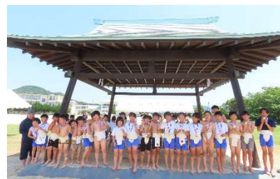
団体戦優勝 西チーム