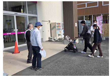
イオン系島店街頭啓発活動の様子

人権週間行事として、街頭啓発活動及び人権映画祭を開催しました。街頭啓発活動は、11月22日(土)に、イオン系島ショッピングセンターにて、各行政区推進委員など23名の参加で人権映画祭のチラシとウェットティッシュを配布しました。