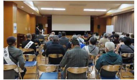
人権映画祭 引津会場の様子

人権映画祭は、11月29日(土)引津コミュニティセンター(参加者51名)、11月30日(日)姫島公民館(参加21名)で開催しました。戦時中の保育施設の集団疎開の物語で、保育園児53名の命を守った保育士さん達の奮闘ぶりが良く描写されており、感動的な良い映画だったと思います。