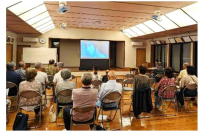
久家行政区の研修会の様子

今年度、引津校区の7行政区で開催された行政区人権・同和教育研修会は、子どもの人権をテーマにした「ヤングケアラー」について学習しました。ヤングケアラーとは、家庭の事情でやむを得ず大人がやるべき介護や他の日常生活の世話を、過度に負っている18歳未満の子どもたちや若者のことです。糸島市では、子どもの権利条例を制定して、相談員が悩みごとや困りごとを聞き、子どもたちの権利を守る取り組みをしています。