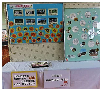
人権パネル展示とひまわりの種配布

また、人権擁護委員さんより引津小学校・姫島小学校3年生が育てた人権の花「ひまわり」の種の配布と活動報告パネルが展示されました。