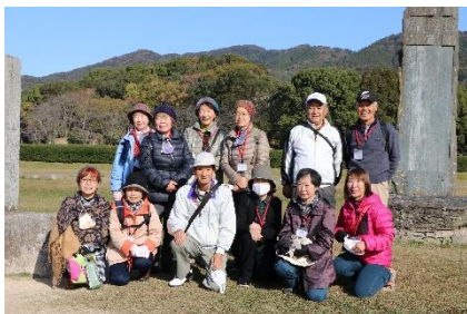
12/2 坂本八幡宮 & 太宰府ウォーキング