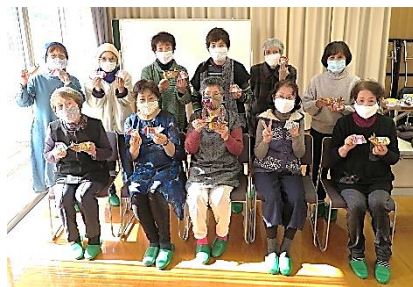
12/8 折り紙で干支作り