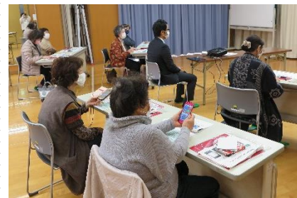
12/10 スマホの機能と注意点