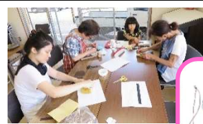
革細工講座の様子