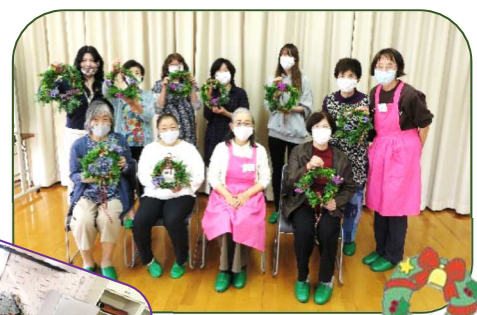
クリスマスリース作り講座