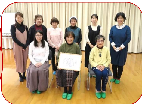
受賞に喜びいっぱいの現会員と立ち上げに関わられたメンバー