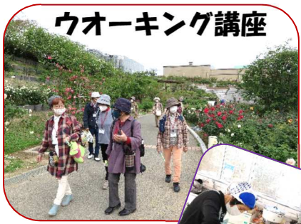
ウォーキング講座

今年度は、新型コロナウイルス感染防止のため、当センターでも人数制限・マスク着用など、感染防止に努めながら講座を開催しています。今後も、ご理解・ご協力をお願いします。