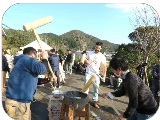
*令和元年の異文化交流餅つき大会の様子です