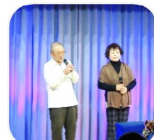
*令和5年1月の出場者のみなさんの写真です