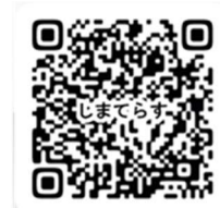
可也コミュニティ センター