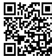
防災メール まもる君

今年は例年より早く九州北部地方が梅雨入りしました。これまで糸島市が発令していた避難情報のレベル 4 は「避難勧告」と「避難指示（緊急）」の二つがありましたが、「危険度が高いのはどちらか分かりづらい」という声があり、「避難指示」に一本化され、対象地域の人は 必ず避難 になりました。発令されたらためらうことなく、早め早めの避難を心がけましょう。