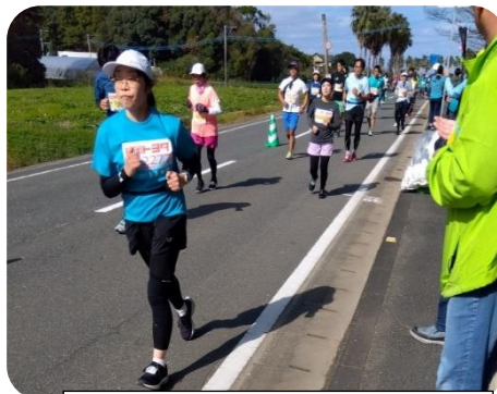
つまんでご卵付近を走るランナー

ゴール後は、おもてなしエリアの志摩中央公園での多くのブースが、美味しい糸島の食で、疲れたランナーや応援者たちを癒しました。