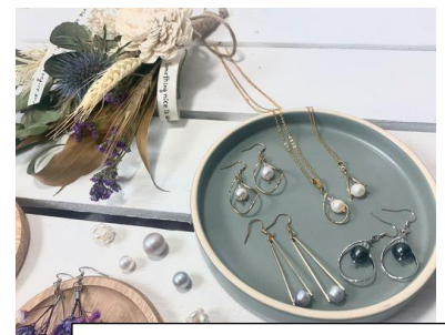
真珠を使ったアクセサリー