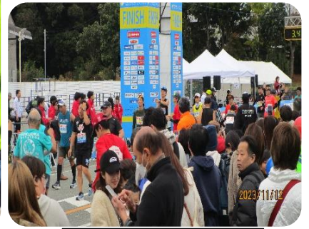
ゴール付近の様子