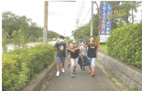
食材のお買いものに行きました