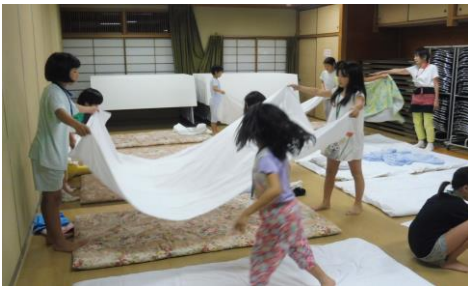
布団もみんなで綺麗にしきました