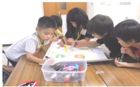
班にわかれてフラグ作り