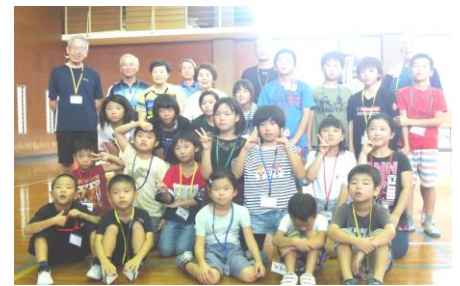
志摩卓球のみなさんと！