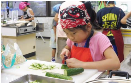
きゅうりも上手に切れました！