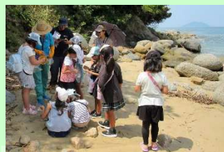
いろんなものが打ち上げられていましたよ

福吉コミュニティセンターからバスで姉子の浜に到着した子どもたちは元気いっぱい。夏の強い日差しの中、砂浜の貝を集めました。後半はコミセンに戻り、講師に聞いたり図鑑を使って貝の名前を調べ、ひとつひとつ箱に貼っていました。夏休みの楽しい思い出になったようです。