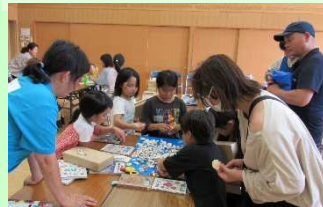
これとこれは同じ貝? 違いを見つけるのも楽しい!