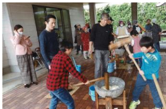
【ふれあい餅つき大会】

コロナ禍前には、12月に子どもからお年寄りまで参加の「ふれあい餅つき大会」を実施していました。