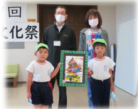
【はこべ幼稚園代表園児】