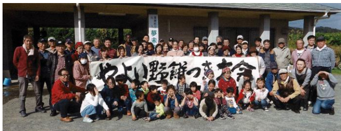
【イベントに集まった皆さん】

二丈中学校の南側からバイパス一帯に広がる、深江校区の中で一番新しい行政区です。ほとんどの住民の方が他の地域から移って来られました。その為、交流や親睦を図る目的で、色々なイベントを開催し、子どもからお年寄りまで多数参加していただき大いに盛り上がったものです。