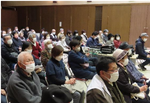
【鑑賞された皆さん】