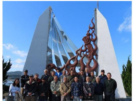
【平戸市焼罪史跡公園】