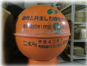
掘り起こされたタイムカプセル

旧二丈町が、平成7年3村合併40周年、町制施行30周年の記念事業として、当時の二丈町の資料等を入