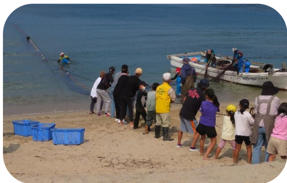
深江海岸の地引網

当日、海岸清掃後地引網を行い、子ども達が元気よく網を引き、飛び跳ねる魚に大はしゃぎで、皆さん、「大きな魚が獲れたかな」とワクワクしながら網の周りに集まっていました。