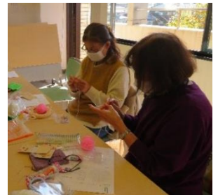
手作りを楽しむ皆さん