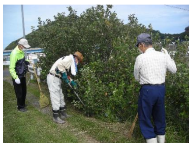
ハマボウ周辺の草刈

堂の前川沿いには、糸島市花「ハマボウ」が多数自生しています。毎年初夏になると、黄色やオレンジ色の花をたくさん咲かせてくれます。