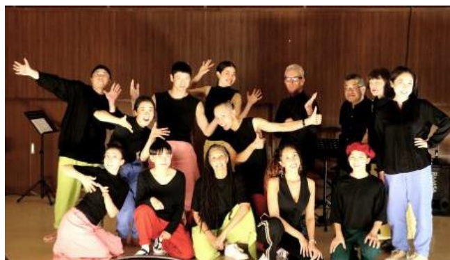
出演されたダンサー・音楽家