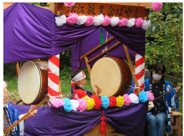
深江放生会囃子保存会