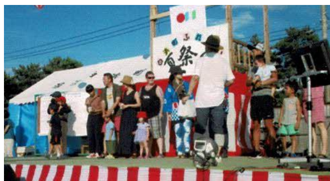
新しい家族も松ぼっくり投げに参加