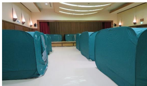
※大研修室に設置したパーテーション 10家族で30人が利用可能