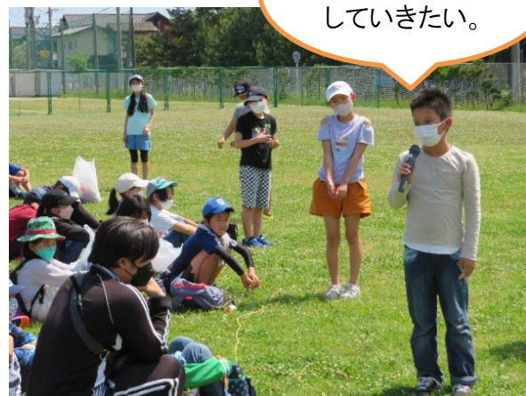
閉会式で発表する深江小学校児童代表