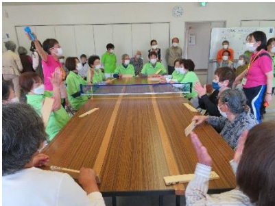
【にぎわった試合の様子】

5月18日高齢者講座【卓球バレー大会】が開催され、選手及び関係者を含めた62名・7チームが笑いの渦の中熱戦を繰り広げました。