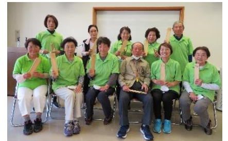
【優勝チーム“あすなろ”】

優勝できた」と喜びの声をいただきました。笑いの中での交流は、皆さんに元気を与えられたのではないのでしょうか？