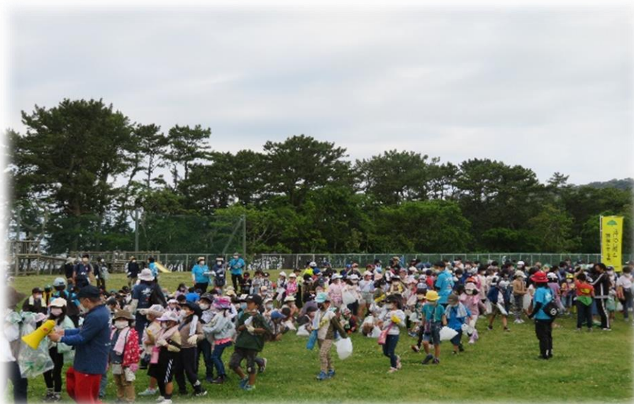
開会式後清掃活動に向かう児童達

また、清掃後には3年ぶりとなる閉会式が行われ、児童から感想を出していただきました。「海岸をきれいにしている人達がいることを今日初めて知った。」「地域の人達と一緒にできたことが良かった。」「プラスチックごみを拾えたことが良かった。」等発表され、無事終了しました。