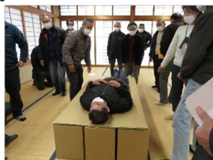
令和3年度訓練の様子