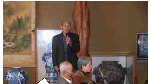
あいさつをされるにじの会会長

食事しながら、カラオケで歌ったり、お芝居を見に行ったりで楽しい一日でした。皆さんが喜んでおられました。参加者の皆様有難うございました。