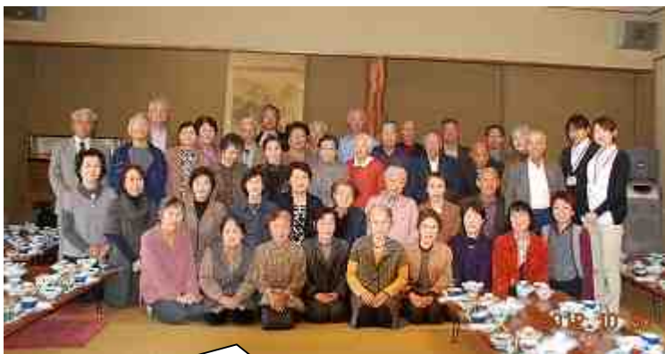
来年も元気にお会いしましょう！！