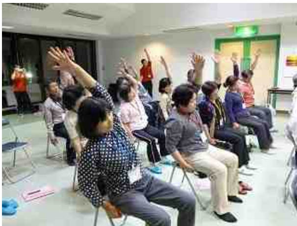
簡単な体操を生活習慣に取り入れましょう