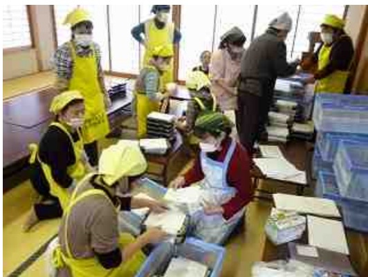
行政区ごとにお弁当を仕分ける作業に便利なコンテナを購入しました

また、今回から配達用のコンテナを購入していただき、新しいコンテナにお弁当を入れてお配りしました。