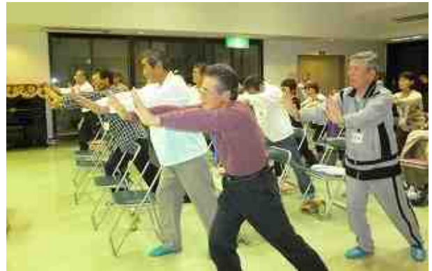
まずは、準備体操のストレッチ

ひとり一人が心身共に健やかに保てるように心掛け、「健康寿命」を長く、日常の生活を過ごしていきたいものです。