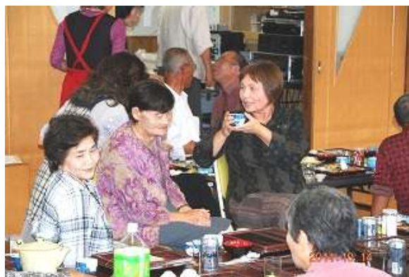
話が尽きない女性陣たちです