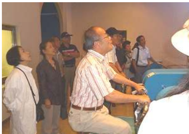
自転車式発電機での発電体験に挑戦！