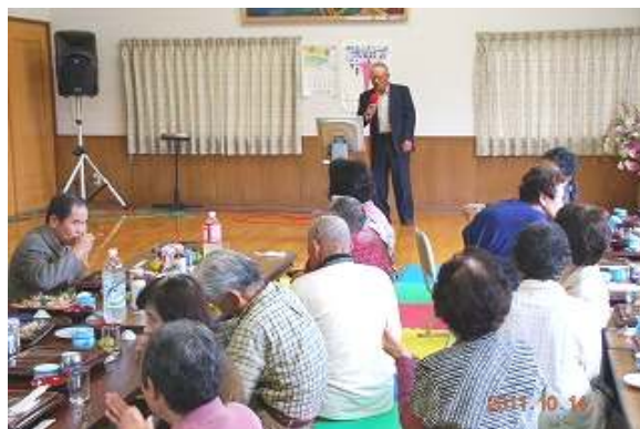
カラオケも 楽しいひととき