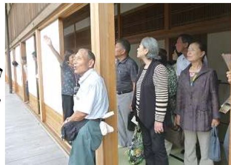
復元された佐賀城本 丸でガイドの説明を 受けました ←