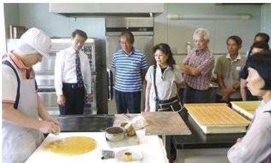
村岡屋工場で丸ポ 口づくりを見学 ←