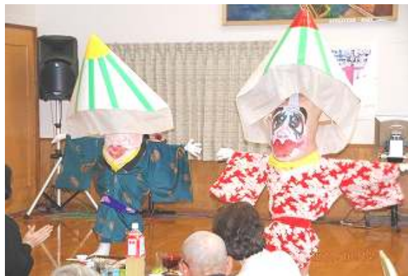
珍しい腹芸に大盛り上がり！