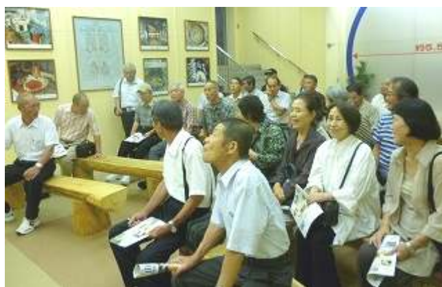
天山発電所の地下にある見学ルームで説明を受ける参加者たち

違うのは発電に使った水を汲み上げ再び発電に使うことです。昼間の最も電気を必要とする時に上ダムから水を落として発電し、その使用した水を消費電力が少ない夜間に下ダムより汲み上げ昼間の発電に備えています。つまり、同じ水を繰り返し利用することで水資源の保全に寄与しています。