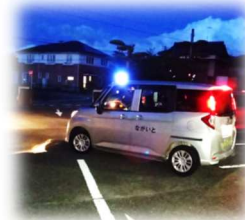
青色回転灯をつけて出発！