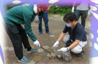
花火のカスは残さないように

校区のみなさま、身体的距離を保っての鑑賞 ご協力ありがとうございました! 消防団のみなさま暑い中お疲れさまでした!