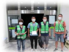
集まったメンバーのみなさん

8月8日(土)と8月22日(土)の2日間、青少年育成指導員会による夜間巡回が行われました。2台の青色パトロールカーに乗り込み、いざ出発！！夏休み中の子どもたちの見守りと地域の安全のために、校区内を巡回しました。