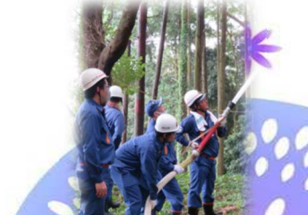
高い場所も念入りに水を撒きます