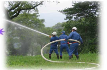
水の勢いがスゴイ! 30m先まで届くそうです 数人がかりでホースを支えます