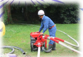
小型ポンプを使ってプールの水を御霊が丘まで送ります

花火には疫病退散の願いも込められています。早く新型コロナウイルスが収束し、みなさんの日常が戻ってくることを、来年は「ながいと夏祭り」のフィナーレで花火を上げることができるよう願っています。