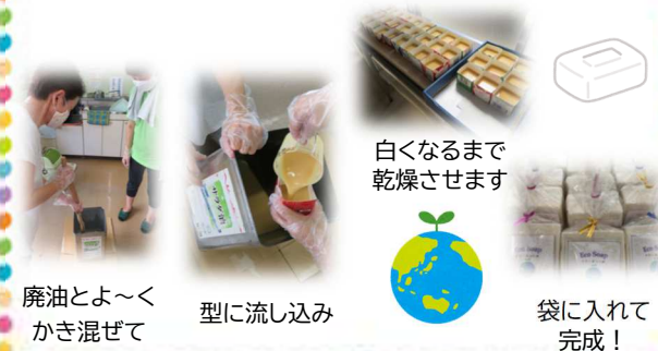
廃油とよ〜くかき混ぜて

愛情たっぷり♡手作り石鹸を使ってみてみたい方は、3R会(連絡先：長糸コミュニティセンター)までお問い合わせください♪