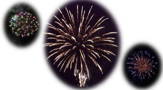
さまざまな大きさ・色・形の花火