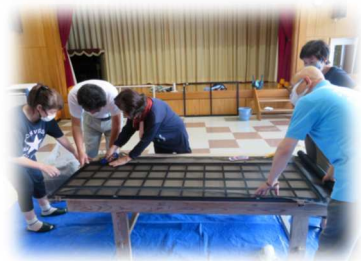
慣れたら1枚5分ほどで張り替えれるようになりました