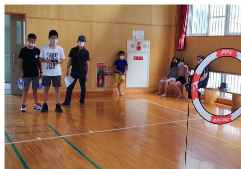
中学生はドローンの設定も操作もお手の物