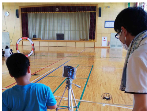
障害物をくぐってゴールに無事着地