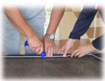
専用の道具で隙間にゴムを入れ込み網を固定させます

古い網を剥がします 網をとめているゴムが劣化でポロポロ切れてしまうため、剥がすのにもコツが必要です