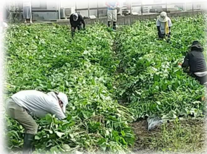
午前中の短時間の作業でも あっという間に汗びしょり

朝9時とはいえ、夏の強い日差しの中での作業は大変です。収穫の際の子どもの笑顔を楽しみに頑張りました！