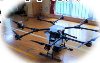
長糸小体育館の屋外で、農薬散布用大型ドローンのデモンストレーションも見学

最初にドローンの簡単な説明を受けた後、トイ(おもちゃ)ドローンの操作を体験。後半は中型や大型のドローンの飛行を見学。その迫力と近未来な様子に参加者は感心しきり。今後の活用に話題が広がりました。