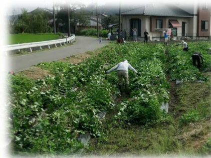
おひさまの光をあびて繁った葉の下ではお芋が養分をたっぷり蓄えているはず