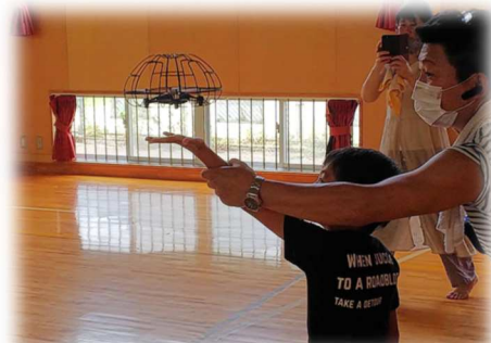
手に着地させたら生き物のよう「かわいい！」