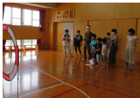
子どもたちも順番に操作体験 覚えの速さに大人はびっくり！