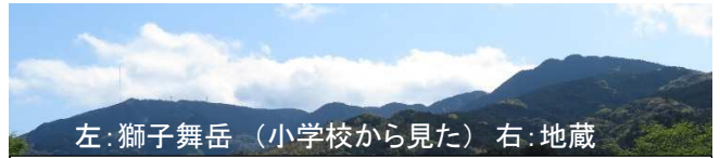
左:獅子舞岳 (小学校から見た) 右:地藏