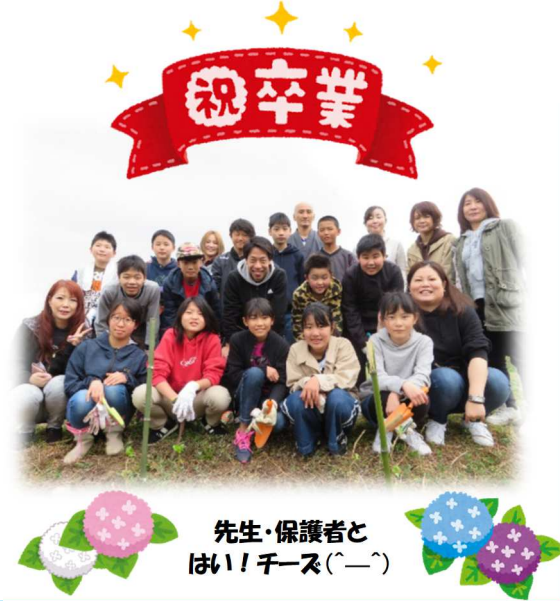
先生・保護者と はい! チーズ(^-^)