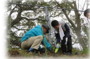
あじさい名人がコツを伝授