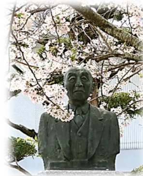
あじさい館の敷地内に 建つ井上俊一氏の銅像 長系を見守り続けています

糸島市市制10周年を記念した糸島市・糸島新聞社の共同企画『郷土糸島の偉人たち』に旧長系村の村長井上俊一氏が選ばれました!