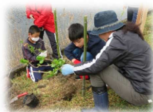
地域の方と一緒に