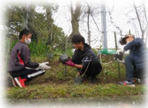
苗をポットから出すのが難しい!