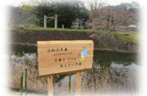
この看板が目印です!