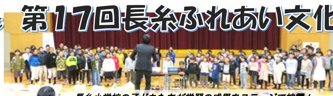
長糸小学校の子どもたちが学習の成果をステージで披露!