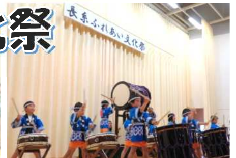
勇ましい長糸保育園の太鼓