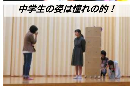
中学生の姿は憧れの的!