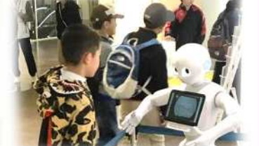
様々な体験が子どもの力になります