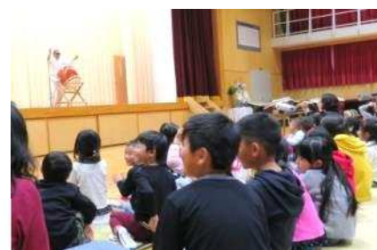
「イケメン」が大ヒット