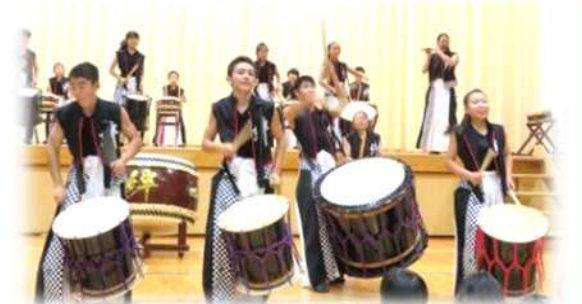
勢いあふれる系島二丈絆太鼓!