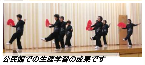
公民館での生涯学習の成果です