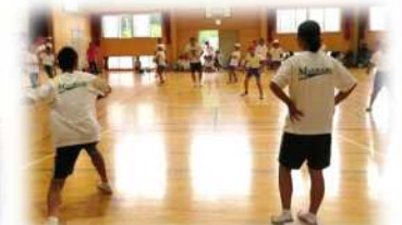
中学生も一緒「子ども体育祭」