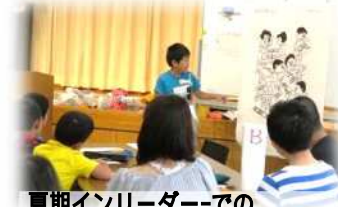
夏期インリーダーでの危険予知トレーニングの様子