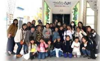
冬季インリーダー研修の参加者

長糸校区子ども会育成会連絡協議会では校区の保護者たちが集まり、子ども達の健全な成長を目的に様々な体験活動や子どもリーダーの育成を行っています。今年度の冬季インリーダー研修は11月19日(月)に実施し2年生から6年生20名が参加。昨年10月のオープン以来子どもだけではなく大人にも大好評の福岡市科学館に行きました。プラネタリウムや科学に関する展示を楽しく学ぶことはもちろん、みんなで公共交通機関や大きな街の公共施設を利用することで、公の場所での団体行動や利用の仕方・マナーなど普段の生活とは違った体験・学習をすることができました。