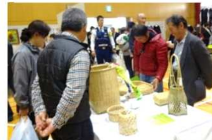
丁寧な手仕事に感心しきり