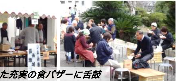
各団体が腕を振った充実の食バザーに舌鼓