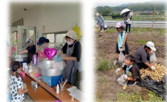
↑昨年度のまちづくり推進事業「ホテルカフェ」の様子

校区内外の人が交流することによって長系校区全体が活性化し、持続可能な長系になることを目指していきます！