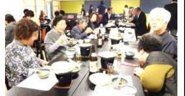
楽しい時間に話はずみずみ

懇親会の余興では「糸島ひょっとこ踊りの会」の方々が登場。カラオケでは次々と美声が披露され、会場からは大きな拍手と笑い声が次々とあがっていました。