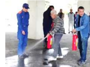
実際にやってみることが肝要