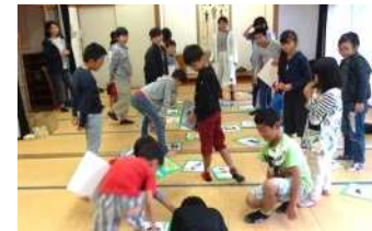
大型カルタも大盛り上がり!