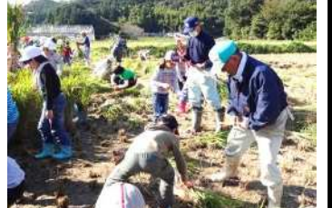
稲束をくくるのは大人の仕事