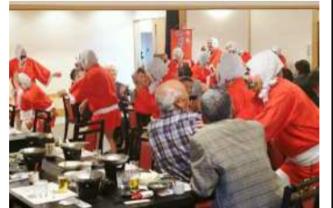
大勢のひょっとこに座も賑わいます