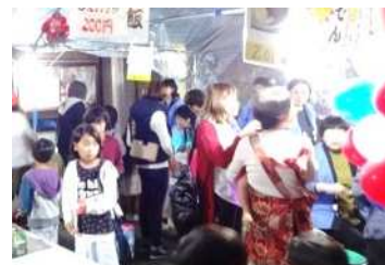
地域有志の露店は小さな子ども達にも大人気!!

10月14・15日、宇美八幡宮の秋季大祭が行われました。昨年に続き雨天となり、残念ながら今年もお神輿のお下りは行われませんでした。14日の露店や祭典には老若男女大勢の方が来られ賑わいました。