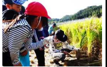
上手に鎌を使う子ども達