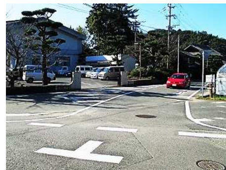
運転者も歩行者も白線を意識して、一時停止と左右確認

公民館前の交差点は登下校時以外にも車や人の往来が多い所です。しかし、交差が直角ではなく道も狭いため見通しが悪く、事故に至らないまでも「ひやり」とした経験のある方も多いようです。