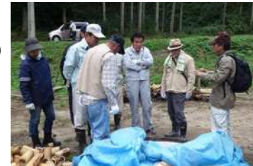
様々な道具の活用方も勉強になります

長系公民館政治学級では、竹の活用と環境整備の先進団体である「かいろう基山」さん(鳥栖市)を訪れ、活動の現状についてお話を伺ったり、実際に竹の伐採などを体験。案内して下さった方の「一体験は百見に如かず」の言葉通り大変有意義な研修となりました。