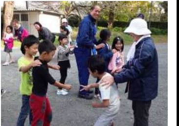
花植えの後みんな一緒に遊びました