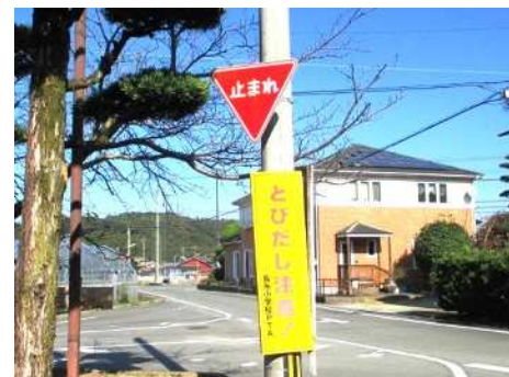
植栽に隠れていた標識も枝を切って見やすくなりました