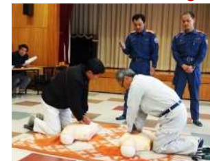
手応えを覚えておきましょう