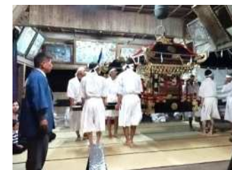
雅楽のみやびな調べの中 厳かに神事が執り行われました