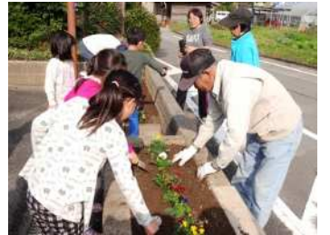
キレイな色、どんな順番にしようかな?

11月9日(木)、長系小学校1年生と環境を守る会、シニアクラブ、白糸農園のみなさんが協力して花植え作業を行いました。子ども達は大人の指導を受け、小さな手で苗の根をほぐし、ひとつずつ丁寧に植えました。大勢での土いじりは、子ども達にとっても楽しい時間になったようです。