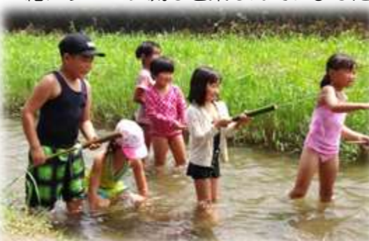
子ども達は川の中で楽しく遊んでいました。

糸島の子育てグループを中心とした「いぶんいぶんリトリート実行委員会」が、8月初めに福島在住の親子を招待したイベントを糸島市で開催しました。8月4日は、川付川のほとりで波多江校区の六十路会の会員等が、子ども達に水鉄砲作りの指導したり、一緒にソーメン流しを楽しんでいました。