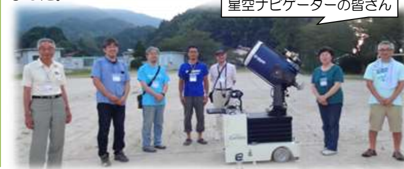
星空ナビゲーターの皆さん

8月8日長糸公民館講座星空観測会を開催しました。天の川をはさんで夜空に浮かぶ夏の三角のこた座、わし座、はくちょう座…約30名が星空ナビゲーターの皆さんの口マンあふれる話を聞きながら夏の夜空を眺めました。また、望遠鏡の向こうに土星の輪が見えた時、みんな感動していました。