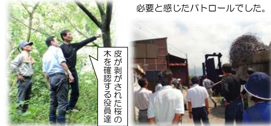
皮が剥がされた桜の木を確認する役員達

7月18日校区役員でパトロールに行きました。今回は飯原と本の施設を調査した後、飯原の不動池上基幹林道にペンキが捨てられた現場、桜の木の皮が剥がされた現場に行ってきました。自然破壊を平気でする人への憤りを感じ、みんなで環境を守ろうという意識が必要と感じたパトロールでした。