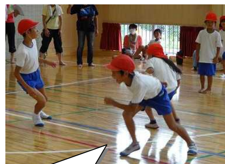
楽しそうにプレーをする子ども達

結果 【小学生の部】 優勝：長野 2位：川付 3位：本B 【中学生の部】 優勝：1、3年生混合Aチーム