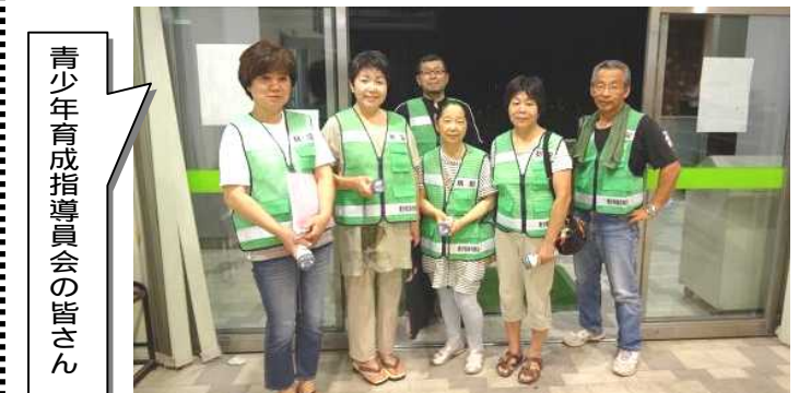
青少年育成指導員会の皆さん

青少年と取り巻く事件が、昨今増えている中、長系の青少年を見守る為、青少年育成指導員達が毎年夏休み夜間パトロールを行っています。