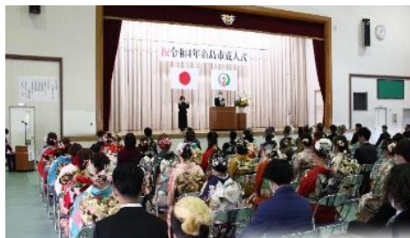
会場：前原西中学校

南風校区では130人が新成人となられ、会場となった前原中学校と前原西中学校に、あわせて100人が集いました。新成人のみなさん、おめでとうございます。