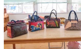
いっかんば 一閑張りの 籠作り講座