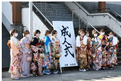
晴れ着に身を包んだ新成人の方々。 久しぶりの再会もあったことでしょう。