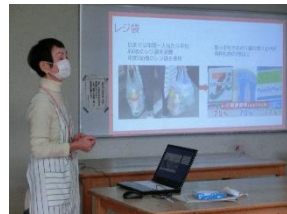
脱プラスチックに関する講座