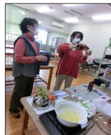
みつろうを溶かし、ハーブの ハンドクリーム作りを行う