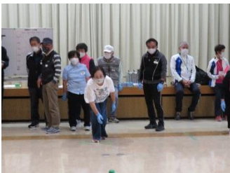
ペタンク講座 最後の回では コミセン対抗試合が白熱！

今年度も前原南コミュニティセンターでは様々な講座を行っています。コミュニティセンターが建替え中のため、東風、南風コミュニティセンターの協力のもと、共催させていただきました。また、あごらや篠原一公民館（自治区の公民館）をお借りしての開催となりました。今秋には新コミュニティセンターも開館予定です。感染防止をしっかりと行い、これからも皆様に喜んでいただける講座を企画していきますので、よろしくお願いたします。