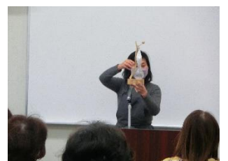
ミネラルを多く含む塩の効能についての 講話