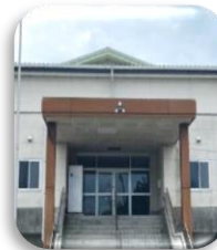
前原中学校 体育館

先月、未曾有の集中豪雨により8月13日~17日までの5日間、前原中学校体育館が避難所として開設されました。線状降水帯の発達により、長期に降り続いて、糸島を含む九州各地に甚大な被害もたらされました。これから台風シーズンにもなりますので、日頃より避難準備を心がけてください。