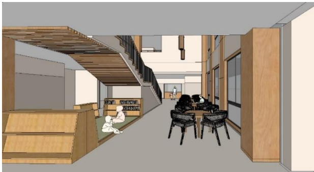
開放感あふれるロビー

今秋、新前原南コミュニティセンターが開館します。会議室や大研修室だけではなく、ロビーには図書コーナーや談話コーナーも設けられ、授乳室やオストメイト(人工肛門保有者)対応トイレも完備されます。