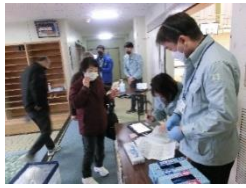
避難者の受付訓練

危機管理課による避難者の受け入れ、避難所で使用するパーテーション、ベッド、簡易トイレの設営、糸島市消防本部消防長より「被災地応援について」の講話、応急担架の作り方、心肺蘇生法 AED の使い方、健康づくり課による感染症対策、非常食の説明など盛りだくさんの内容でした。参加者からは、「とても有意義だった。一度だけで終わることなく、継続していただきたい」との声も多数ありました。避難所運営訓練は今後センター運営においても最重要項目であり、次年度以降も継続して実施する予定です。