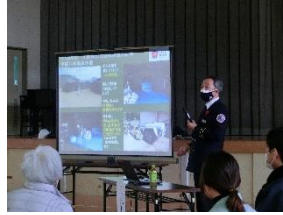
消防長より被災地の話