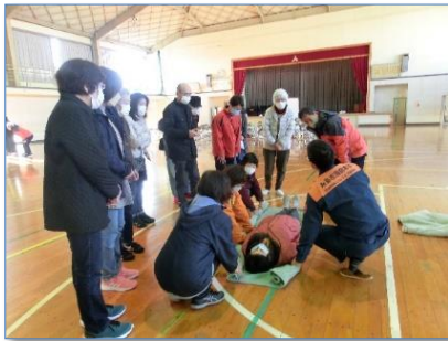
毛布と棒で担架を作り、病人等を運ぶ