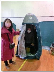
簡易トイレが出来上がり