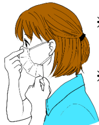
②マスクは顎下まで伸ばし顔に隙間なくフィットさせる