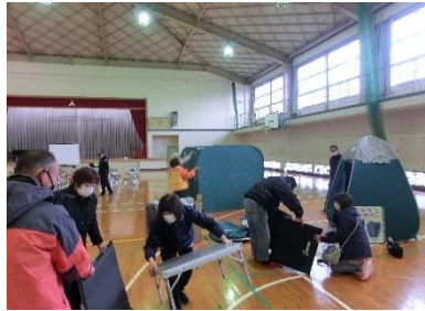
パーテーションやテント作り