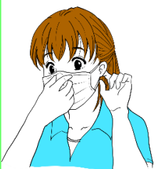
①鼻の形に合わせ 隙間をふさぐ

令和2年は、インフルエンザの患者数が大幅に減少しました。マスクの着用や手洗い等、感染予防対策の徹底が要因の1つと考えられています。感染予防対策を継続し、インフルエンザを予防しましょう。