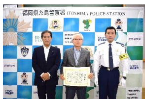
菰田会長が表彰伝達式に出席