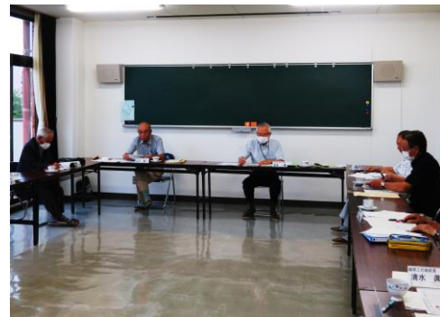
今年度はじめて 行われた区長会

今年度は、各校区団体などセンター利用者は新型コロナウイルス感染拡大防止のため当面の間、総会や会議など書面で開催する状況でした。5月23日(土)から感染防止対策をしっかりとしながら施設利用が再開されました。6月18日(木)に今年度になって初めての区長会も行われ、今も心配される新型コロナウイルスとどう向き合っ校区事業等を取り組んでいくか話し合われました。