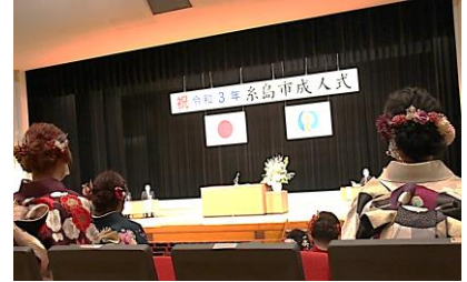
厳かな式典の様子

前原南校区の成人式対象者100人のうち、54人が出席しました。コロナ禍での開催のため、保護者の参列や集合写真がなく例年の華々しい雰囲気にはならなかったですが、厳かな成人式を行いました。