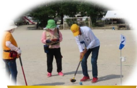
【シニアクラブ】5月27日(土) グラウンドゴルフ大会

コロナ明け、校区各団体でたくさんの事業が行われています。様々な活動からたくさんの笑顔と歓声をいただいています。校区のみなさまも、色々な活動にぜひご参加ください！