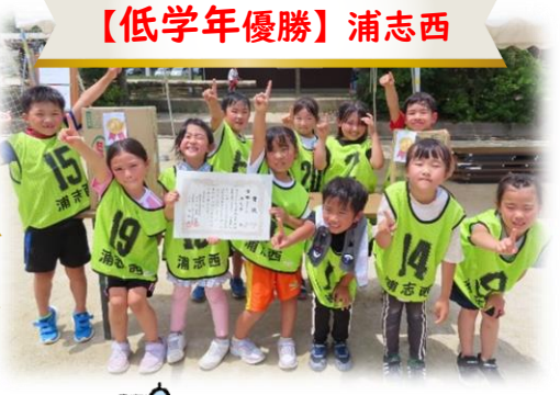
【低学年優勝】浦志西