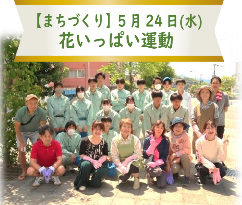
【まちづくり】5月24日(水) 花いっぱい運動