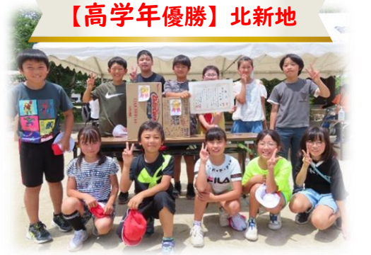
【高学年優勝】北新地