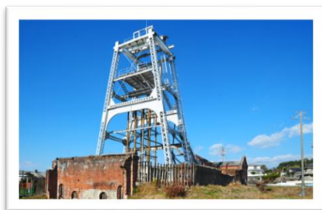
【大牟田の近代産業遺産 HP より引用】