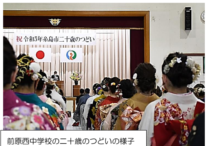
前原西中学校の二十歳のつどいの様子