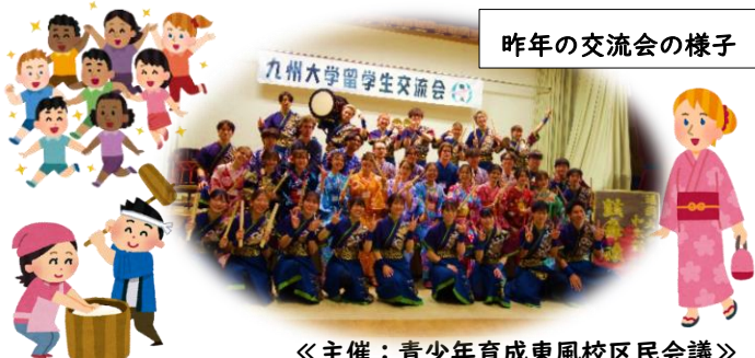
昨年の交流会の様子