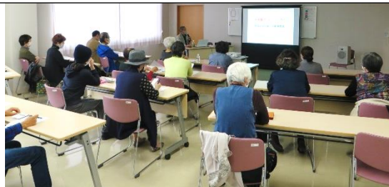
教養講座 映像で見る！四季折々の糸島を巡る旅