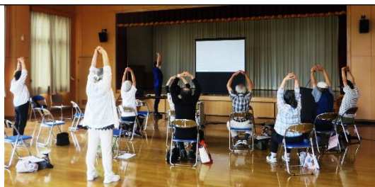
健康づくり講座 熱中症と脱水について