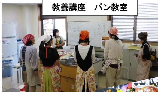
教養講座 パン教室