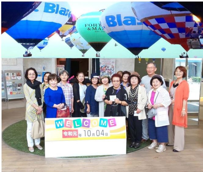
すみませ～ん 何人かお買い物中です (^o^)

最初に見学したのが佐賀バルーンミュージアム。ここは熱気球に関する色々な展示や映像が観賞できます。熱気球の本物は想像以上の大きさにビックリしました。映像では壮大な佐賀平野上空に色とりどりの熱気球が浮かんでいて、壮大さに感動します。サロンの皆さんはフライトシミュレーターを体験して大空に浮かんでいました。昼食会場へ移動する前に佐嘉神社を散策してもらい三瀬の「大八そば」で「ざるそばと天ぷら盛合わせ」を食べました。帰りに野菜直売所マツちゃんに立寄り、買い物を楽しんでもらいました。