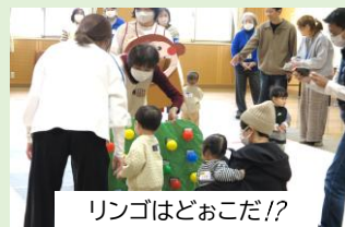
リンゴはどここだ!?