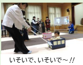
いそいで、いそいで~!!