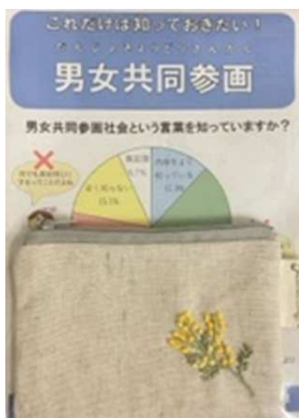
▲ 啓発リーフレットとミモザポーチ

著名人による講演会を実施することにより、多くの市民(特に今まで男女共同参画に対する関心が低かった人たち)への啓発を図る。