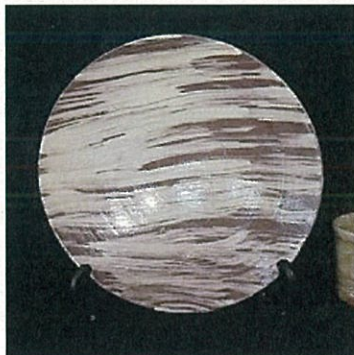
《自治功労者等記念品》