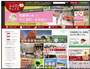
「ふるさとチョイス」