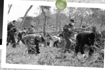
枝拾いアクション