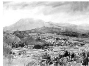
雨曇り・可也山遠望