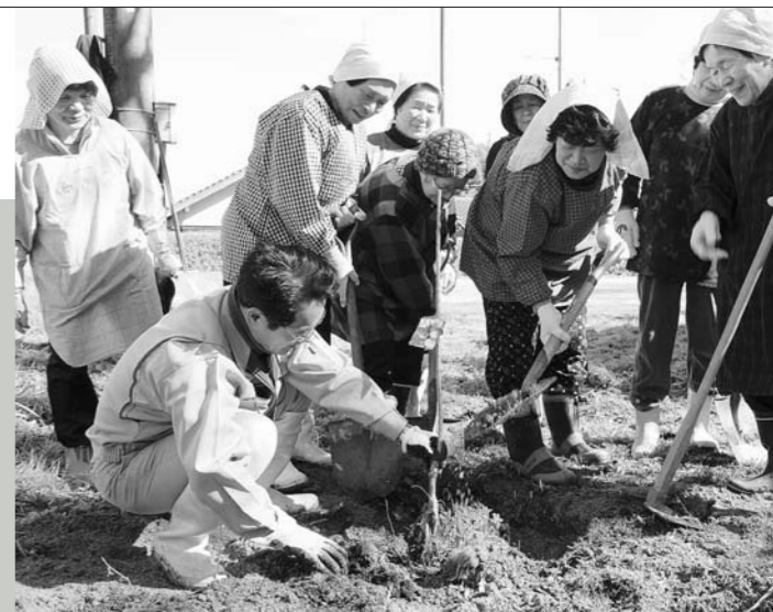
5年前から野菜作りのためにコンポストを使い始めた「趣味の会」のみなさん

市とJA糸島、地域が協働で進める、生ごみのたい肥を使った梅づくり事業の第1弾が2月20日、波呂公民館で行われました。 今回使用したたい肥は、地域のみなさんが段ボールコンポストで家庭から出る生ごみや調理用油をリサイクルしたもの。梅の木や資材は、JA糸島から提供され、その後は地域で手入れします。 段ボールコンポストは、JA糸島で1,000円で販売されており、その半額を市が補助しています。