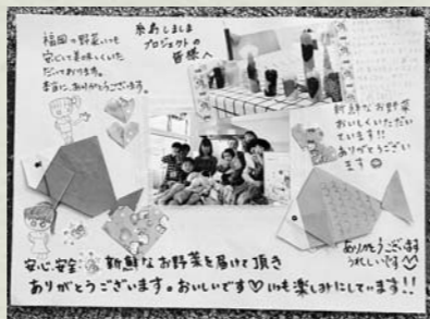
野菜を受け取った人たちから届いた「新鮮なお野菜を美味しくいただいています」のメッセージ

イモ・カブなど、他にレモン・ツクシなど、すべて糸島の農家などからの寄付で、1箱に15〜20キロ分を詰める。野菜は無料で、受取人の負担は送料のみ。「安全で美味しい野菜が食べられて嬉しい」との声の他、「カブ・白菜などのようにして食べるのですか」との問い合わせがあるなど、食文化の交流も生まれている。 「米・野菜の農産物から、塩・味噌などの調味料、パンなどの加工品まで何でも揃う。それが糸島の大きな魅力」と語る。干し野菜用の竹かご製作は、賛同した知り合いが引き受けてくれた。「魚も送りたいから、同級生の漁師に野菜と物々交換してもらおうかな」