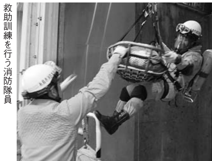
救助訓練を行う消防隊員

職員が誤ってごみピットに転落したことを想定した訓練を2月27日、市クリーンセンターで行いました。訓練には、糸島市消防本部も参加し、通報を受けてからの情報の伝達、転落者への措置、救助の方法を確認しながらの訓練が行われました。当センターでは、あらゆる災害を想定した訓練を毎年行っており、今後も職員の安全を守るため、訓練に取り組んでいきます。