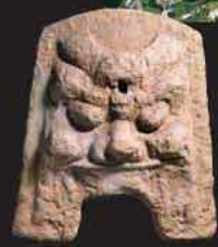
怡土城跡から出土した鬼瓦

大宰府防衛の最前基地として高祖山西斜面に築かれた古代山城。吉備真備が指揮を執り756年に築城開始、12年の歳月を経て完成した。現在も長大な土塁の一部や建物の礎石などが残っている。