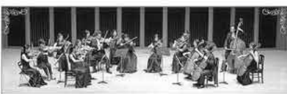
響ホール室内合奏団のみなさん

毎回みなさんの身近な場所で気軽に本格的な生演奏を楽しめると好評の「みんなのコンサート」。今回は、「響ホール室内合奏団」団員による弦楽五重奏を企画しました。ヴァイオリン(2人)、ヴィオラ、チェロ、コントラバスの5人編成。弦楽器の音の重なりをお楽しみください。