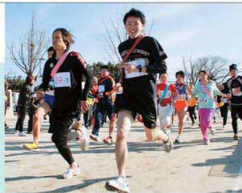
毎年、市外から多くの選手が自分の限界に挑戦しに訪れる

糸島の新春恒例のイベント「糸島駅伝大会」が2月3日、可也小学校をメイン会場に開催されました。43回を迎える同大会には、われこそはと市外からもたくさんチームが参加します。今年は全52チームが参加し、可也山を2周する全長約26キロのコースで、優勝を懸けたデッドヒートを繰り広げました。最後は、志摩中学校陸上競技部が1時間28分44秒のタイムで2位以下を3分以上引き離しゴール。昨年に続き2大会連続で優勝を飾りました。