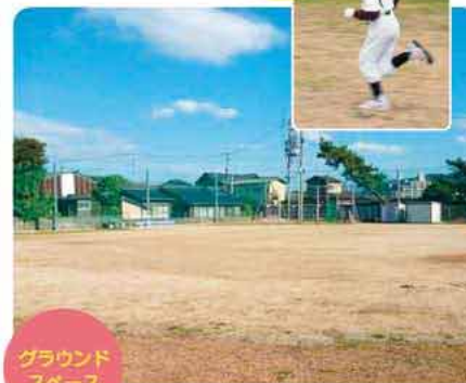
グラウンドスペース