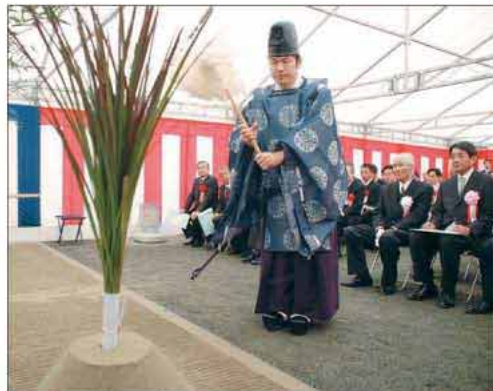
事業の安全な運行を祈念して厳かな式典が行われた