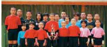
元気に素直に練習に励む東風カブトと東風ハッピーのメンバー