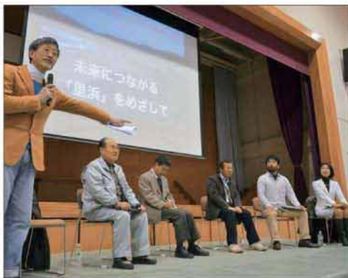
早速、市民による枝拾いで、害虫駆除をしようと呼び掛けられた(22ページ参照)

海岸線の松枯れを止め、かつての美しい姿を蘇らせようと、2月17日、芥屋地区で300本の松の植樹を行い、志摩中学校体育館で「松林保全再生シンポジウムin糸島」が開催されました。この中で、専門家から「松の保全地域を決定し、場所によっては広葉樹へ樹種転換すること」などの必要性が示されました。今後は、害虫の習性、薬剤空中散布の時期、松や広葉樹の特性など、知識を共有し、より良い方向へ導くために議論する場ももたれる予定です。