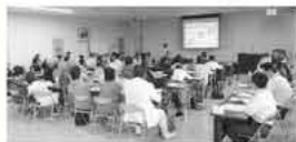
昨年の公開プレゼンテーションの様子