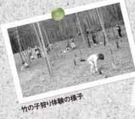
竹の子祭り体験の様子