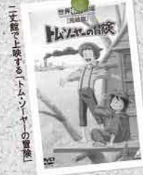
二十歳以上限定「トム・ソーヤーの冒険」