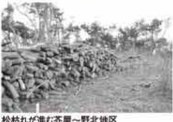
松枯れが進む芥屋~野北地区

松枯れの感染源の一つとなる「落ち枝」。これは、機械を使った枯れ木の林外搬出では拾いきれないもので、松林内に無数に点在しています。放置しておくと、さらなる松枯れの原因となるため、市民ボランティアの手により、まずは100万本の回収をめざします。昼食はおにぎりとしし鎖を用意します(有料200円)。