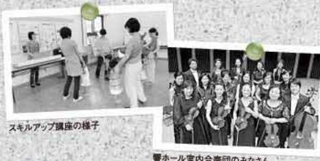
スキルアップ講座の様子

3月10日(日)13時~15時 深江公民館 無料 30人(申し込み不要) 糸島鍼灸マッサージ師会 ☎(322)3815 Eメール hari_tokuji@yahoo.co.jp