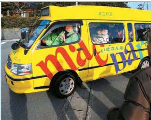
利用者に乗せた自主運行バスの第1便が出発した

一貴山校区の自主運行バスの運行開始式が1月29日、一貴山公民館で行われました。自主運行バスとは、地域のボランティアが運転手を務め、車両や燃料などの運行費を市が負担するものです。地域と市が協働で運行するため、路線などを細かく設定し、高齢者などの移動手段を確保できる他、家族の負担が減らせる効果があります。式典が終わると、早速、利用者が乗り込み第1便が出発しました。