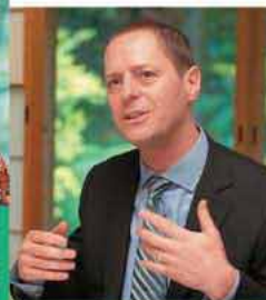
月刊情報紙 「FUKUOKA NOW」 発行・編集長

1974年福岡市出身。結婚後の東京在住時、東日本大震災を経験。家族で芥屋へ移住し、地元住民との交流を図りながら、日常の出来事・風景をブログで発信している。西日本新聞記者時代、「食卓の向こう側」の連載を担当。食が生活に及ぼす影響の大きさを、身をもって伝えた。