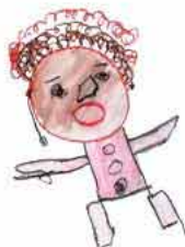
障がい者支援施設MUKA(むか)のみなさんが描いたイラスト

平成25年1月1日 福岡県糸島市発行 ☎092(323)1111 糸島市公式ホームページアドレス http://www.city.itoshima.lg.jp