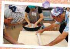
ファームパーク伊都国 公開講座 (そば打ち教室)