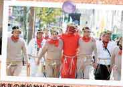
昨年の老松神社「追儺祭」