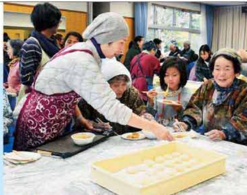
搗いた餅は、子どもたちからの手紙を添えて、一人暮らしの高齢者へ

米を蒸す・杵と臼で搗く・丸める、という一連の作業が見事な連携で進み、参加したベトナム・中国などの留学生も、日本の伝統文化と一緒に楽しんだ他、集まった約200人の老若男女が、甘酒や豚汁を味わいながら、おしゃべりに花を咲かせました。