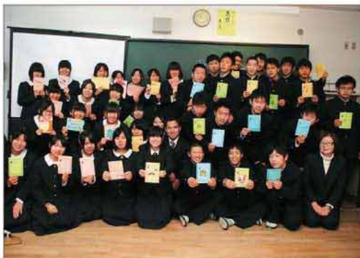
紙で飾りを付けたり絵を描いたりし、気持ちがこもった温かみ溢れるカードが出来た。