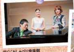
宝くじおしゃべり音楽館