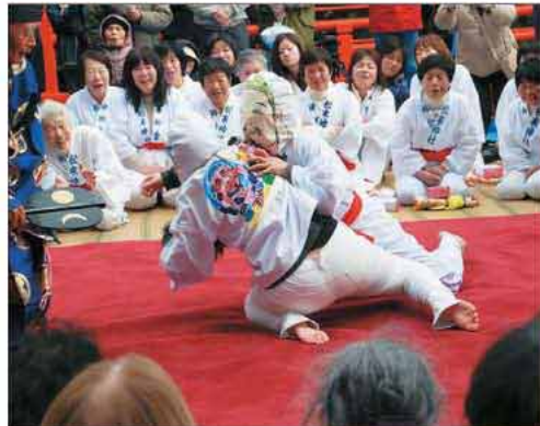
参加者の中には、この相撲に参加するために東京から訪れた人も

試合が始まると、なかなか相手を見つけれずに擦れ違ったり、豪快に投げ飛ばされたりと、来場者たちの笑いを誘っていました。