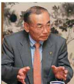
松本 嶺男 糸島市長