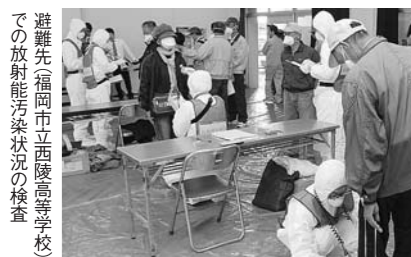
避難先福岡市立西陵高等学校での放射能汚染状況の検査

10月28日、九州電力玄海原子力発電所でのトラブル発生を想定し、原発から30km圏内にある糸島市内の住民約130人が、福岡・春日両市への広域避難訓練を体験。避難先での放射能汚染を調べる検査(スクリーニング)などを実施しました。 避難手段、避難経路、高齢者などの要援護者対策など、まだまだ課題が山積しています。訓練は、繰り返し実施していく必要があります。