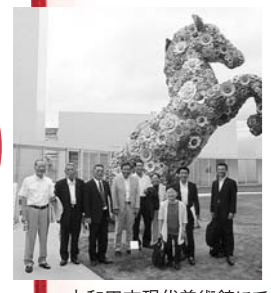
十和田市現代美術館にて

(活用すべき事項など) ビジョンを具現化できるパートナーを選定した後、その業務に不要な干渉をせずに専門家に任せることができたことが、成功につながっている。