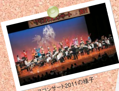
クリスマスコンサート2011の様子