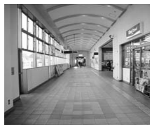
市が管理するJR筑前原駅の自由通路

答 南北を接続する自由通路を計画している。エレベーターについては、市が2基、JRが1基設置し、合計で3基を設置する予定である。