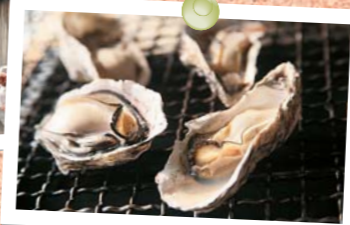
糸島の冬の名物「焼き牡蠣」