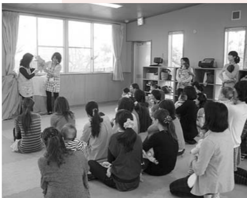
子育て教室：絵本の読み聞かせの様子

問 認定こども園法の改正により、「新たな幼保連携型認定こども園」の制度が創設されたが、神在保育所に導入すべきではないか。 答 公立保育所については、糸島市行政改革大綱や市の経営理念にのっとり、民間活力を導入することで、その存続は考えていない。従って、神在保育所を認定こども園にすることも考えていない。 問 子育て支援センターで行われている事業の成果と課題を尋ねる。 答 子育て支援センターでは、地域における子育て支援、子どもの心身の健やかな成長に資する教育環境の整備、要保護児童への対応など、きめ細やかな取り組みの推進に向けた事業を展開している。 課題は、二丈・志摩地区の子育て