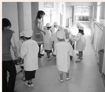
児童・生徒が楽しんでいる学校給食

答 副校長などの新しい職については、学校の規模や状況に応じて配置されている。その配置については、県教育委員会の所管となっており、県教委の人事権の中で決定される。