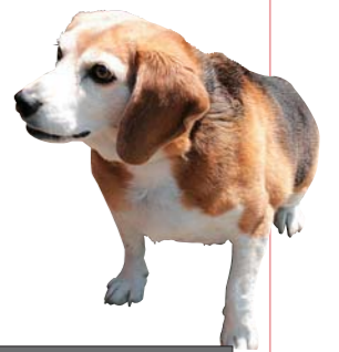
マナーを守って飼いましょう

福岡県の条例により、犬の飼い主には、飼っている犬を常に連れておく義務があります。違反した場合は、5万円以下の罰金または科料に処せられることがあります。 また、放し飼いは、咬傷事故の原因にもなります。他人を傷つけてしまわないためにも、犬の放し飼いは絶対にやめましょう。 たいせつな家族の一員であるペットが、周囲からも愛されるように、ペットはマナーを守って飼いましょう。