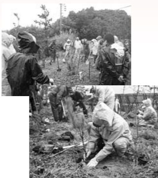
寺山海岸における松苗の植林作業の様子