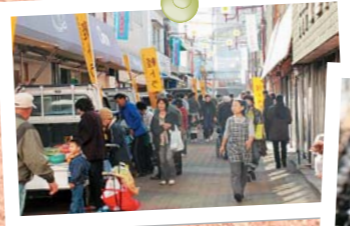
唐津街道前原宿「軽トラ市」