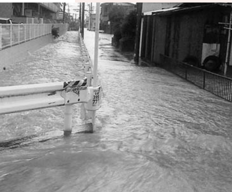
集中豪雨により冠水した道路(高田)

問 教育長として、現場の教師に望むことは何か。また、いじめている子どもたちと教育者として、大人として、人間として伝えたいことは何か。 答 いじめられている子どもを最後まで守り抜くという強い信念をもって、校長を中心にいじめ問題に対処する学校であってほしい。 いじめは、たとえどんな理由があろうともいじめた方が悪いのであって、人間として許されない卑劣な行為であり、すぐにいじめを止めてほしいと願っている。