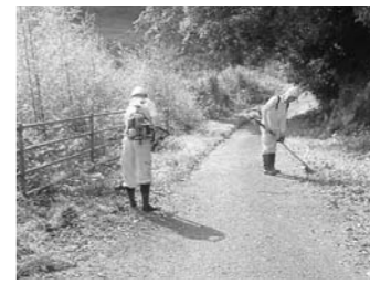
道路の除草作業の様子

方法で実施するよう示されており、現時点で変更する考えはない。 問 国道や県道における除草の要望は、国や県に伝えているのか。また、除草作業の時期についても伺う。 答 市民から要望があれば、国道事務所、県土整備事務所に取り次いでいる。除草の時期については、夏から秋にかけて実施している。 問 道路の危険箇所点検はどのように行っているのか。 答 平成23年度に道路路面の目視点検、本年度は通学路の安全点検を実施した。その他、市民からの通報、道路パトロールにより危険箇所の把握、修繕を行っている。 問 6月定例会で質問した、通学路における路肩のカラー化の実施については検討したのか。 答 福岡都市圏8市町を調査したところ4市で実施されていた。カラー化の実施については、設置の場所や効果の検証、費用の問題などを含め検討したい。