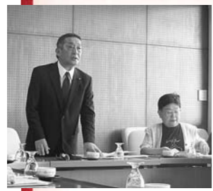
先進事業について意見交換(弘前市)

●青森県七戸町(7月12日) 七戸町は新エネルギービジョンを策定し、太陽光発電やチップボイラー導入などに對する補助や、自治体では全国初の電動バス導入、電動軽トラックの実証実験などの事業に取り組んでいる。モデル地区としてPRすることにより、事業費に補助金や寄付金などを充てることが成功している。