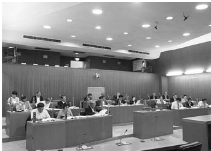
議員全員で構成される決算審査特別委員会の様子