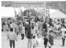
昨年の伊都祭の様子

6回目の開催となり、おなじみのイベントとなった今回も、心踊るステージパフォーマンスをはじめ、糸島地域と九州大学の良さを詰め込んだ数々の素敵な企画や特産品販売など魅力満載です。