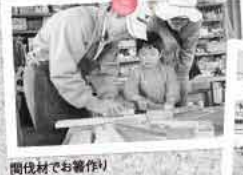
間伐材でお書作り