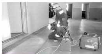
高機能投光器も搭載しています

紹介した消防用ポンプ以外にも、火災や救助現場で活躍する高機能投光器を積載しており、災害現場での照明に威力を発揮します。 他にもさまざまな最新機器を装備しており、最前線で活躍する隊員の活動をサポートし、住民の安全と安心を確保する機動力として今後活躍していきます。