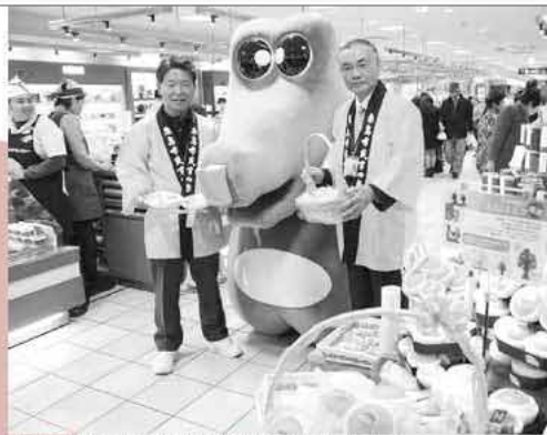
いとゴンの強力なアピールで、たくさんの買い物客を引きつけていた

会場では、商品を買ったり、「いとゴン」と記念写真を撮ったりと買い物客でにぎわっていました。