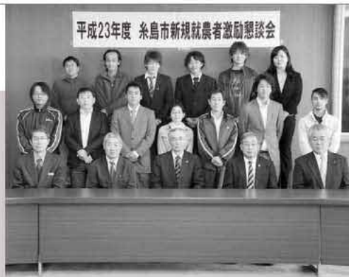
これからの糸島の農業を引っ張ってくれることでしょう

就農者は、会社を辞めて農業を始める人や、家の農業を継ぐ人などさまざまで、合計20人が一堂に会し、横のつながりを強めていました。