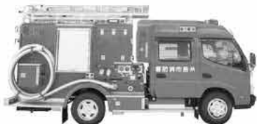
更新された消防ポンプ自動車

糸島市消防本部警防課 ☎(332) 8027 糸島市公式HPより ポンプ自動車 更新 検索