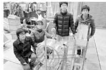
九大生が制作した光る発電機「みどりくん」

福島第一原子力発電所の事故や地球温暖化の進行、エネルギー資源の枯渇などを受けて、太陽光や風力、バイオマスといった再生可能エネルギーが注目されています。 九州大学工学研究院の島谷教授のグループが白糸の滝下流の水を活用し、小水力発電の設置をめざす「白糸の滝1、2、3ステッププロジェクト」の研究が進んでいます。