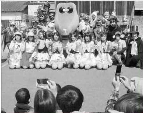
ブレイク必至! 船越生まれの漁業戦隊フィッシャーマンたち

このヒーローたちの出演・脚本・衣装作成など、すべて引津保育園の保育士さんたちによるもの。子どもから大人まで楽しめるよう演出も工夫され、コミカルで笑いの絶えないショーに、多くの買い物客が足を止めて見物していました。